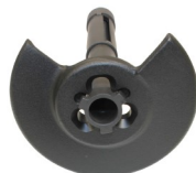
3-punkt Arretierung am Spannzylinderkopf