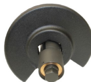
6-fach Rastsystem an der unteren Platte