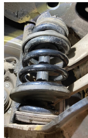
Beispiel: gespannte Feder beim Audi A6 C8 4K

-max. Spannweite 220mm, -min. Spannweite 115mm, -Spannweg 105mm,