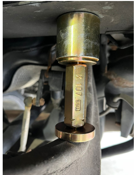
eingesetzt beim Audi A4 8K mit Verlängerung